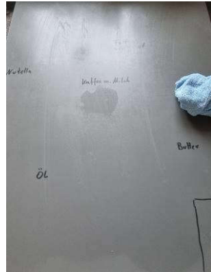
2. Feucht abwischen