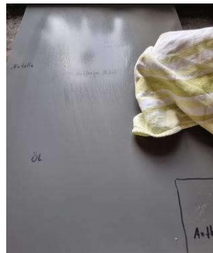
6. Front mit Baumwolltuch gleichmäßig trockenreiben