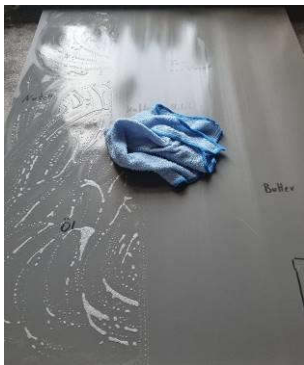
5. Reinigungsrückstände nach Wirkzeit mit heißem Wasser und Microfasertuch abnehmen