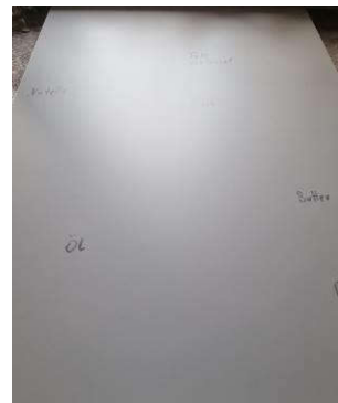
7. Streifen- und schlierenfreies Ergebnis