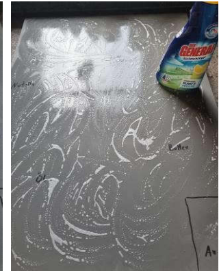
4. Reiniger flächig auftragen